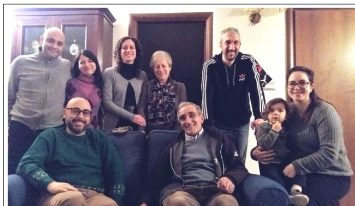
gruppo giovani sposi di Palestrina (Roma)

Anche se talvolta si avverte la stanchezza della settimana lavorativa, tuttavia è un momento importante per ciascuno di noi: è un'occasione per pregare, raccogliersi, riflettere, confrontarsi tra noi sul nostro quotidiano ed anche per ricavare aiuti e consigli pratici dalle Parole dei Messaggi.