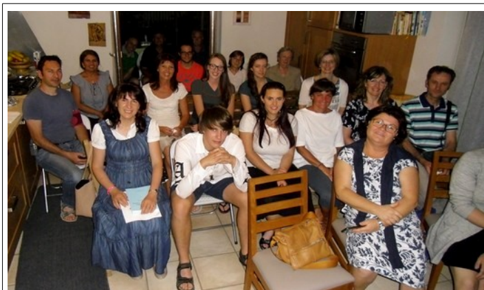
gruppo di Pergine Valsugana (Trento)