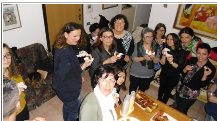
gruppo di Matera

È bene ricordare qui anche quei gruppi che sono sorti in epoca recente, e di fatto sono costituiti quasi esclusivamente di giovani coppie, per esempio a Gubbio, Matera e Pergine Valsugana. Mostriamo qui soltanto le loro foto.