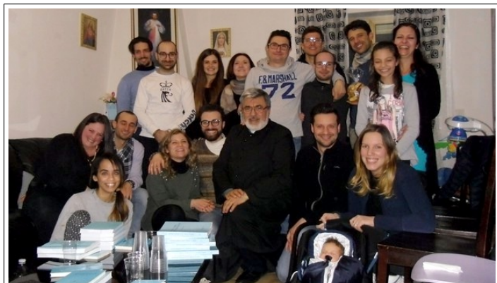
gruppo di Gubbio (Perugia)